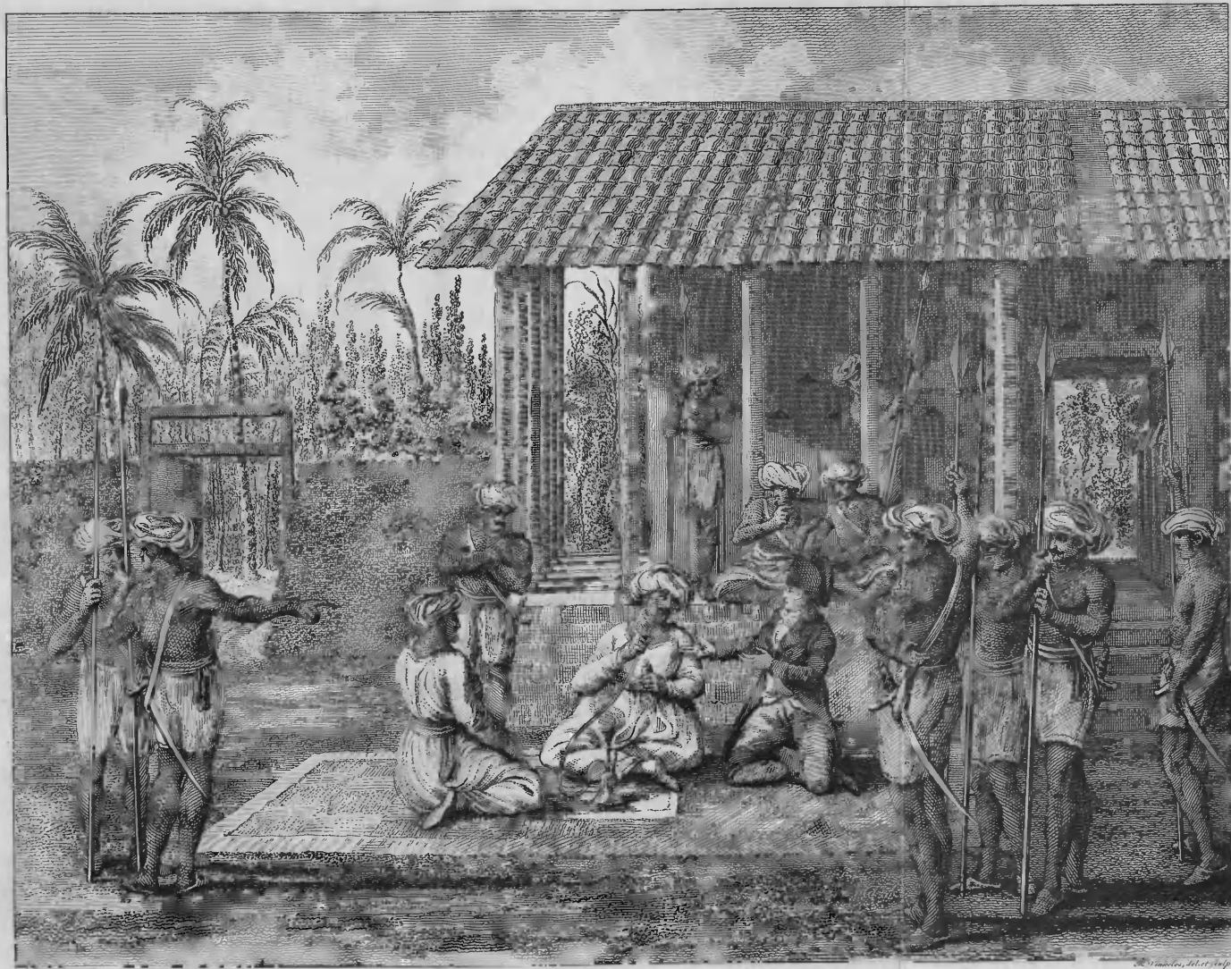
ONDERHOUD MET DEN JAMMEDAAR TE ALAMPARVÉ.