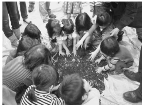
子どもの野菜作り体験の様子

1年目、2年目は研修が主な活動内容だったが、3年目となった2012年、その成果が現れた。資源循環課の協働推進員の呼びかけで、社会教育課・国保健康課・子育て支援課・市民協働課・秘書広報課などの協働推進員が連携して、「生ゴミのリサイクル」と「食育」「子どもの野菜作り体験」を重ねて、世代とジャンルをまたがった「生ゴミリサイクル元気野菜づくり講演会」を企画した