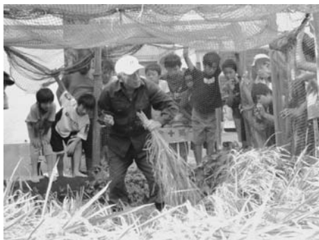
農業経験者の地域の方

具体的な事例として、久木小学校の田んぼづくりをご紹介します。小学校では稲を栽培する授業が行われるが、市内に田んぼがない逗子では児童がバケツに苗を植えて体験学習をしている。そこで久木小学校ではコーディネーターが農業経験のある地域の方を紹介し、校庭の一角に本